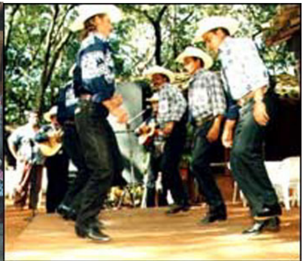
Catira ou Cateretê