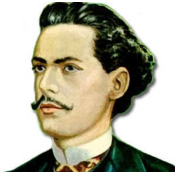
Antônio Frederico de Castro Alves - poeta brasileiro (* Curralinho, 14 de março de 1847 — + Salvador, 6 de julho de 1871)

Lendo a obra de Castro Alves encontrei uma poesia denominada Canção do Violeiro que musiquei, Jayminho Lima gravou com o arranjo de Gabriel Alves Gonçalves , disponível no meu site em: http://www.outorga.com.br/musicas/Canção%20do%20Violeiro.mp3