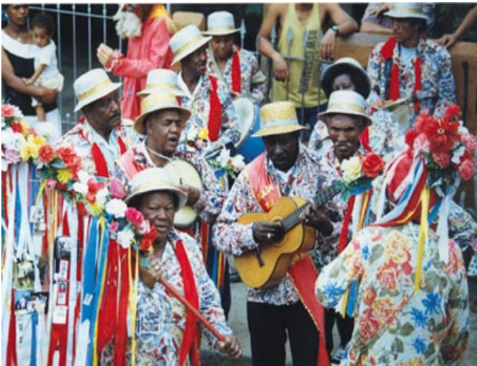
Folia de Reis

As tradições populares como folias de reis, catiras, bem como a música caipira das famosas duplas que surgiram com o advento do rádio, são manifestações onde a viola está presente e tem sua história fortemente influenciada por esse instrumento.