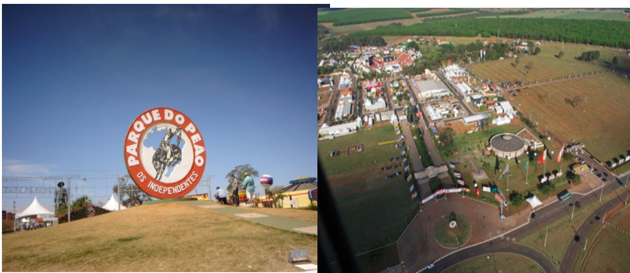
Parque do Peão de Boiadeiro – Os Independentes – Barretos - SP